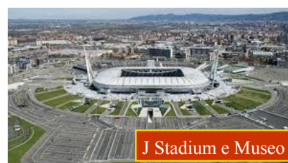
J Stadium e Museo