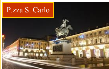
P.zza S. Carlo