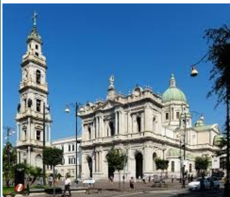
Santuario di Pompei