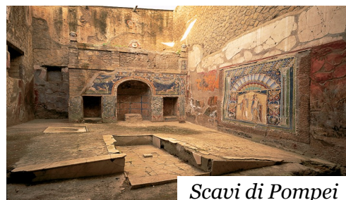
Scavi di Pompei