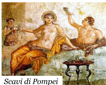
Scavi di Pompei