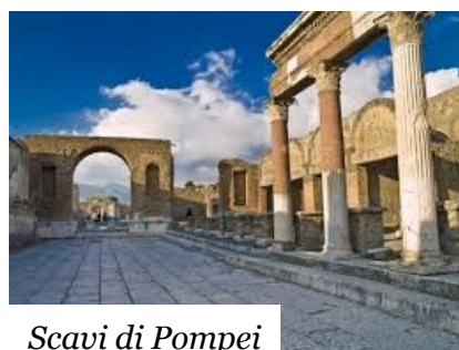
Scavi di Pompei